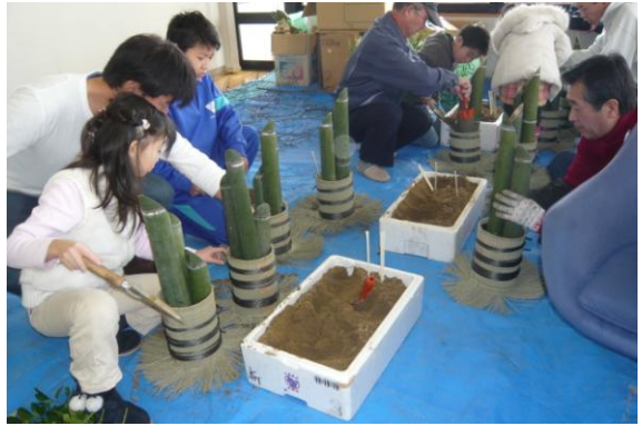
青竹を固定するため砂を入れる。