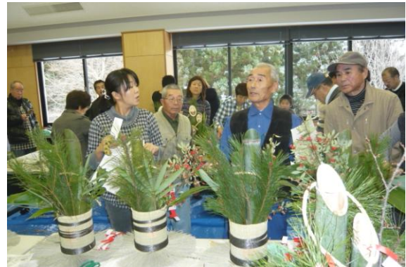
仕上げについて講師の総括指導