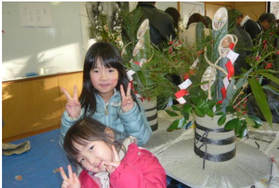
家族で飾り付け完了、ハイチーズ