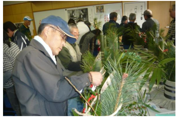
マイペースで飾り付け