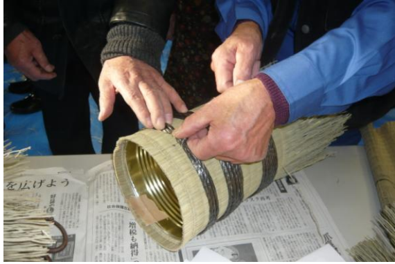
上からロープを3巻、5巻、7巻し男結び