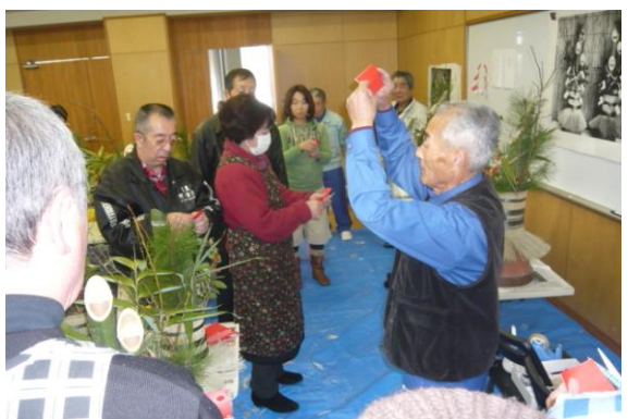
講師による飾り紙（幣束）のつくり方