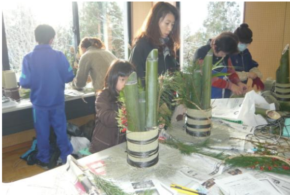
各自青竹を3本立ててみる。