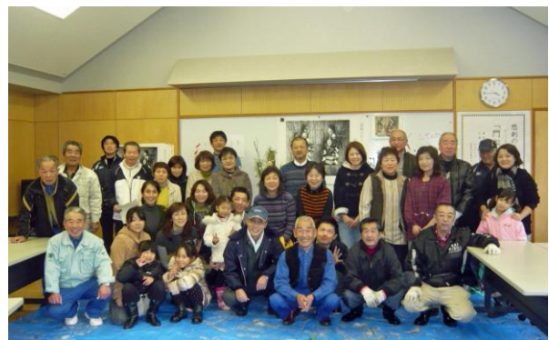
講師中心に全員で完成記念撮影

門松は縁起物ですので講師の指導どおり門松を飾る時期と撤去する時期に注意してください。 設置期間が終わると門松を処分しなければなりません。その作法は特に決まったものではないの ですが、講師の後日談によると以下のようにすると気持ちよく片付けられるとのこと。