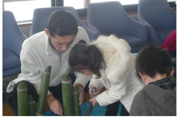
親子で缶に青竹を立ててみる。