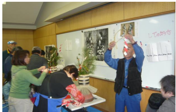
縄の結び方と幣束の付け方