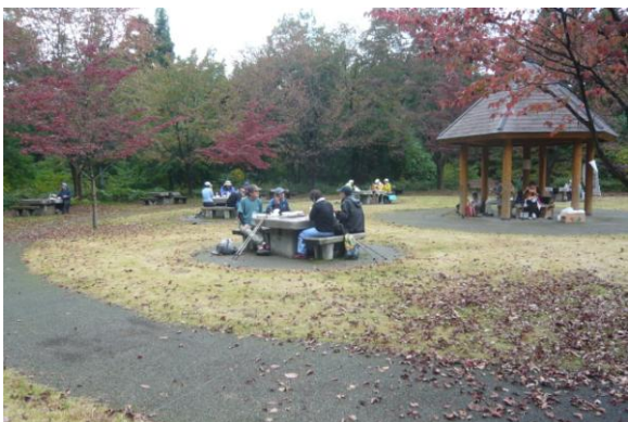
バーベキュー広場で昼食 全員にためしてガッテン風トン汁をサービス。 バーベキューテーブルで三々五々食べる。