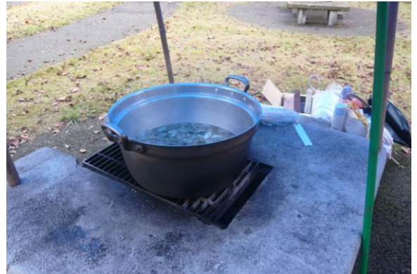
西蔵王公園施設管理共同体（やまがたスポーツパーク㈱、㈱富田造園デザイン、 ㈱西蔵王開発）の合力で調理しました。 トン汁はうまいと好評をいただきました。