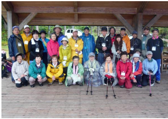
雨模様を見ながら記念撮影