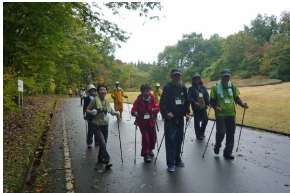
西蔵王公園に到着