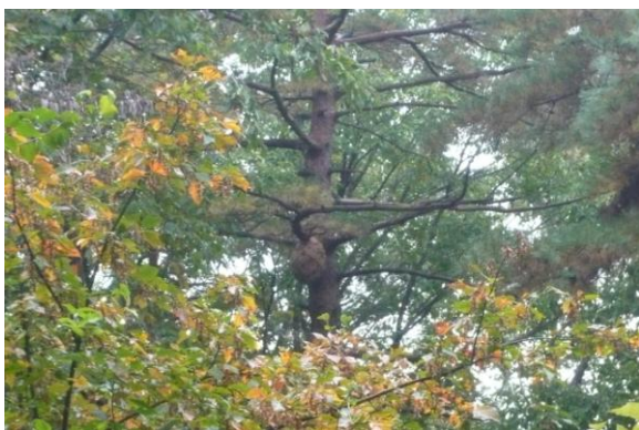
道路脇のマツ林でカメバチの巣を発見