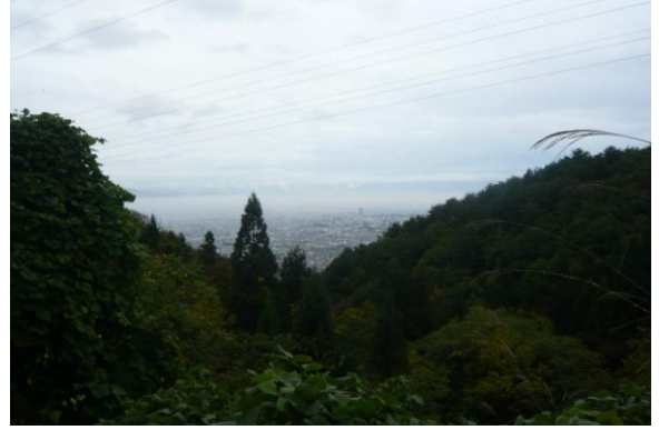
このルートで数少ない眺望地点 見慣れない不法投棄防止監視カメラが設置