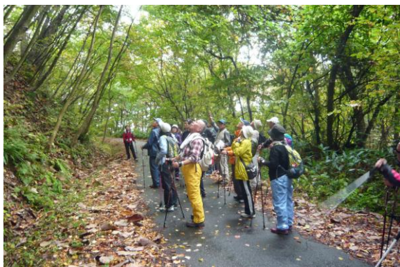
ウリハダカエデの群生地でカエデの不思議の話