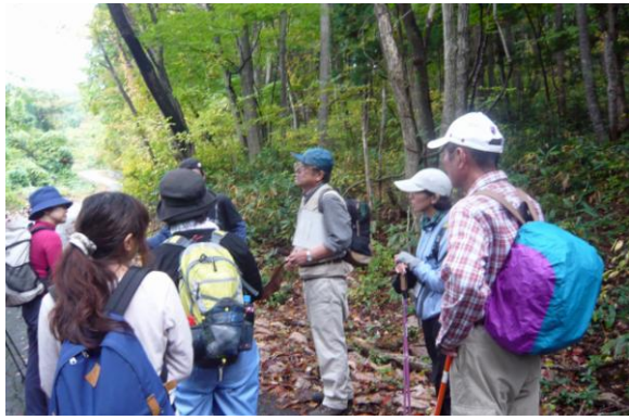
一億年生き延びているホオノキの不思議