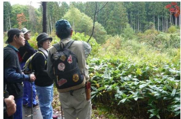
オオヤマザクラの生えているところで山形のサクラの話等