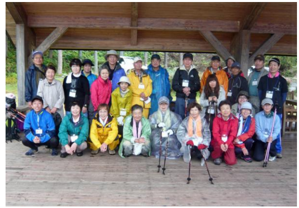
皆さん汗をタップリかいてご満足の様子